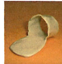
図1. MP extension block splint

MP extension block splintを作成。MP関節伸展位0° (図1,2,3)。splint素材はイージーフォーム3.2mm (酒井医療社製)を使用。splintは，日中・夜間の装着を義務づけ，ADLでの罹患指の使用に制限は設けず使用を促した。訓練時にはsplintを外し，MP関節が伸展拘縮しないようpassive ROM-exを実施。